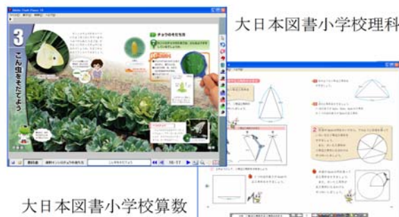
大日本図書小学校理科